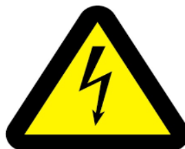
3.attēls “Elektrības brīdinājuma zīme”