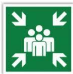
1.attēls “Drošas pulcēšanās vietas zīme”

Izdzirdot trauksmes sirēnu, visiem, kas atrodas Skolā, ir nekavējoties jāpamet Skolas telpas atbilstoši evakuācijas plānam un jāpulcējas pie Skolas pagalmā pie zaļās pulcēšanās zīmes (skatīt 1.attēlu).